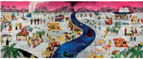
Huang Hai-Hsin "River of Little Happiness" 2015, pittura a olio su tela, 203 x 489 cm

E Cemelesai Takivalet, con Serie di virus (2020), ci conduce nel sud di Taiwan, dove un gruppo di giovani della tribù di Cemelesai ha contratto una misteriosa malattia dopo aver svolto ricerche sul campo per dei virus e dei batteri rilasciati dall'ambiente naturale. Stéphane Verlet-Bottéro, Margaret Shiu e Ming-Jiun Tsai, con Arts of Coming Down to Earth (2020), ci introducono a un esercizio di carbon mirroring , una indagine che utilizza vari strumenti di monitoraggio delle emissioni di gas serra e set di dati per documentare il contributo della Biennale alla combustione del mondo, dalla produzione di opere d'arte ai viaggi degli artisti e al raffreddamento dei musei. DJ Hatfield, Siki Sufin e Rahic Talif, con A Different Gravity: Held by the River (2020), ci chiedono di instaurare un rapporto positivo coi fiumi che attraversano Taipei. Aruwai Kaumakan, con The Axis of Life (2018), ci porta nella tribù Paiwan nel sud di Taiwan dove con lana, cotone, rame, seta e perle di vetro, e con la tecnica Paiwan si intrecciano ricordi di vita della nobiltà tribale. Altri artisti internazionali si presentano con una impostazione dal forte accento politico, come nei lavori di Franck Leibovici e Seroussi, Jonas Staal, Femke Herregraven, Hamedine Kane.