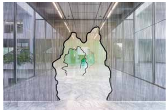
Daniel Steegmann Mangrané "∞" 2020, tende in alluminio Kriska e telai in acciaio tagliato al laser e verniciato a polvere, dimensioni variabili.