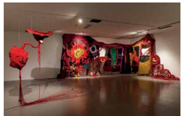
Aruwai Kaumakan "The Axis of Life" 2018, tessuto riciclato, cotone, cotone organico. Veduta dell'installazione, Taiwan Indigenous Peoples Cultural Park, 2019.