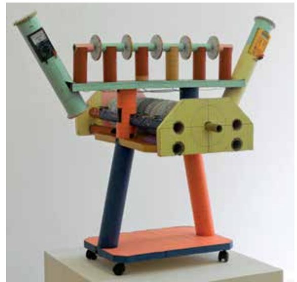
Jean Katambayi Mukendi "Yllux" 2012, cartone, penna, carta, cavi elettrici, ruote di plastica, 102 x 119 x 93 cm. Courtesy of trampoline, Antwerp © Gladstone Gallery, New York, Brussels

Infine, la zona dei "New Diplomatic Encounters" è uno spazio workshop per portare le persone del pubblico a partecipare a discussioni su quanto proposto dalla mostra, cercando modalità espressive affinché si possa riuscire a interagire tra questi diversi pianeti. In definitiva, un pluralismo che può esaltare ogni soggettività e ogni desiderio di esprimersi.